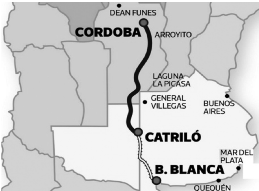
Figura N° 2: Trayecto previsto para la Hidrovía Continental Argentina. Comisión Argentino Holandesa (2018) 77 .

La idea es generar un corredor logístico fluvial que, en conjunto con la red vial y ferroviaria existente, establezca una salida alternativa a la de la Hidrovía del Paraná para los productos de exportación. Esto, además, materializaría las condiciones para el eventual asentamiento de centros logísticos que se conviertan en núcleos de desarrollo industrial y urbanístico. Estas ideas se han plasmado en el proyecto multipropósito denominado Hidrovía Continental 76 .