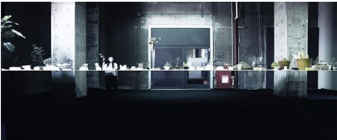
Junya Ishigami, “Table” (2006)

e) Como señala Damián Tabarovsky, existiría algo parecido a una metodología “Héctor Libertella”. Según explica, sus textos trabajan en la fricción entre ruptura y resistencia, hermetismo y comunicación, autonomía y mercado, vanguardia y post-vanguardia, “pero cada uno de esos polos contiene la memoria de su antagonista, de su contrario” (“Los atributos”, 43). Esto, sin embargo, no debe leerse como una forma de convivencia (una forma de la síntesis incluso desde la tensión) entre esos dos polos, sino más bien “como la imposibilidad de esa convivencia dentro del texto, la imposibilidad de esa simultaneidad, de esa doble existencia [...] estos dos polos no se articulan, no se estructuran, no se posicionan; no se aloja allí ninguna dialéctica. La escritura de Libertella lleva al extremo esa doble imposibilidad, la imposibilidad de la memoria y la vanguardia. La suya es la escritura de esa imposibilidad” (43). ¿No hay un eco acá de lo que ocurre en esa enciclopedia que tanto le gustaba a Foucault en la que la simultaneidad de los elementos, además de señalar el carácter arbitrario de toda organización, de todo orden, pone también en cuestión el lugar de esa escritura, la posibilidad misma de escribir esa enumeración o de volverla legible? En este sentido, John Wilkins (y con él Borges y Libertella) es un precursor de Ishigami y de su mesa imposible, aquella en la que sacar o agregar un elemento no solo altera la disposición