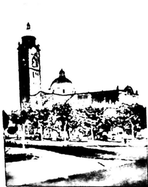
• Foto de 1930. Vista sudeste de la iglesia con las naves laterales