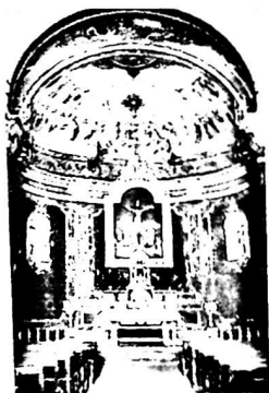
• Foto de 1941. Vista del altar mayor.