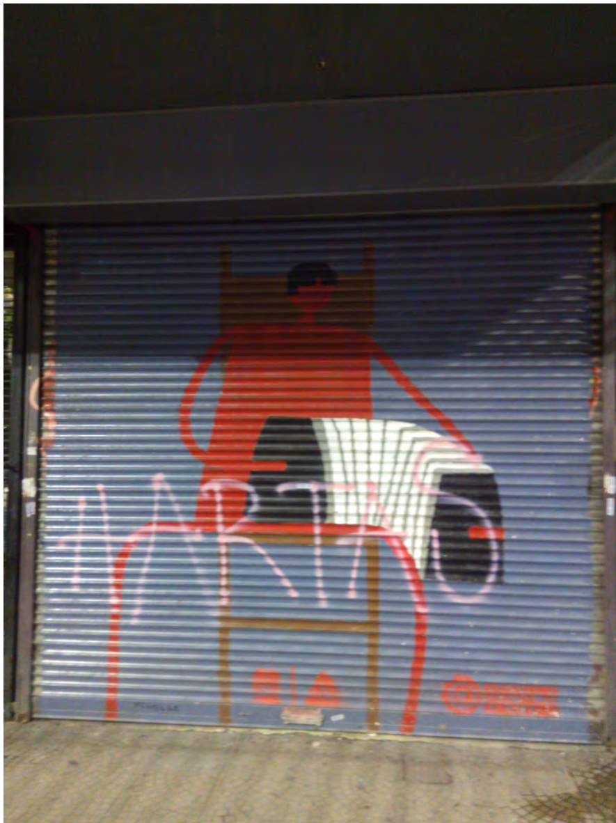
Imagen 3. "Un bandoneonista". Grffiti . MChelle. Avenida 18 de Julio 1458. 18/11/2017. 2,70 x 3 m.