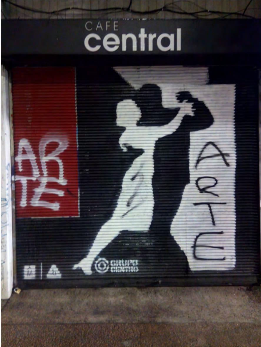
Imagen 2. “Al compás del compás”. Graffiti . Marcelo Piriz. Avenida 18 de Julio 1458. 18/11/2017. 2,75 x 3,20 m.