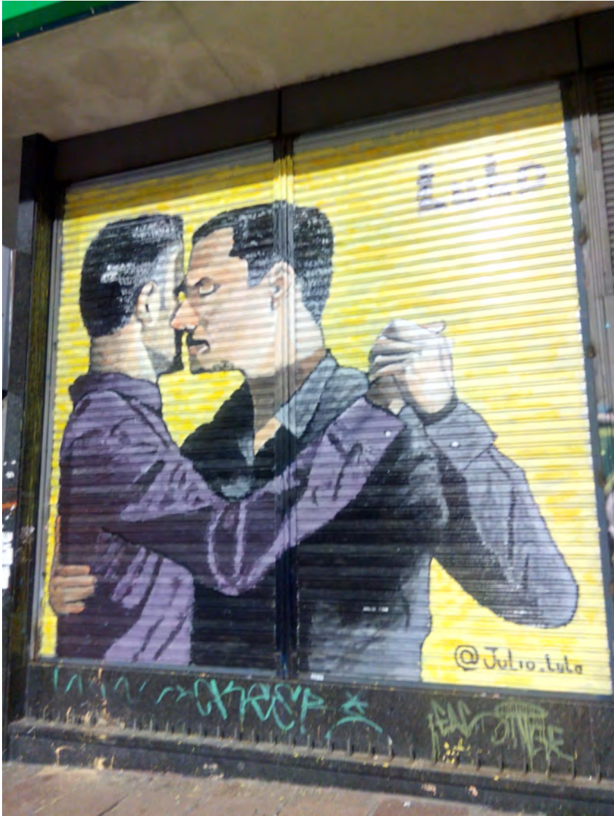
Imagen 1. “Dos hombres bailan tango”. Grffiti . Julio Lulo. Avenida 18 de Julio y Barrios Amorín. MIDES. 18/11/2017. 3,70 x 2,70 m