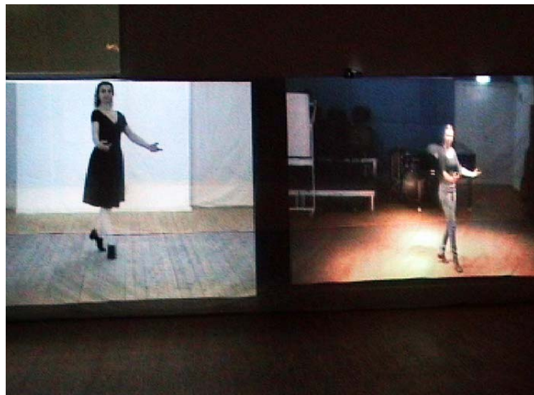
Figura 1 - Instalación “ Dance with me... ”, Pérez Bergliaffa, Amsterdam, 2009

“Hoy día es un hecho aceptado que aprender de las fuentes originales [...] conduce a un estilo de ejecución diferente. Aprendemos técnicas específicas y acumulamos una percepción y sensibilidad especial hacia ciertos objetivos estéticos producidos por una sociedad que ya no existe. Nosotros, ejecutantes históricamente informados, fuimos entrenados para eso. Pero, al mismo tiempo, vivimos en el mundo contemporáneo, un mundo que ha producido su propia tecnología y que posee sus propias ideas estéticas sobre cómo representarse a sí mismo.” 5