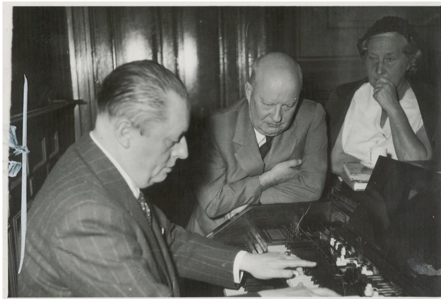
Imagen 7. Paul Hindemith y su esposa Gertrud Rottenberg observan atentamente a Julio Perceval en el órgano. 1