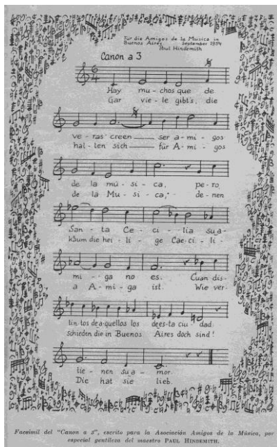
Imagen 4. Del programa de mano del 29 de septiembre de 1954.

nea organizado y dirigido por Julio Perceval y auspiciado por la Asociación 'Amigos del Instituto de Estudios Musicales' en colaboración con la Facultad de Filosofía y Letras de la Universidad Nacional de Cuyo y la Asociación Filarmónica de Mendoza. Este evento tuvo lugar entre el 7 de octubre y el 10 de diciembre y comprendió una serie de conferencias, conciertos sinfónicos, recitales, audiciones de música de cámara y de música vocal y coral.