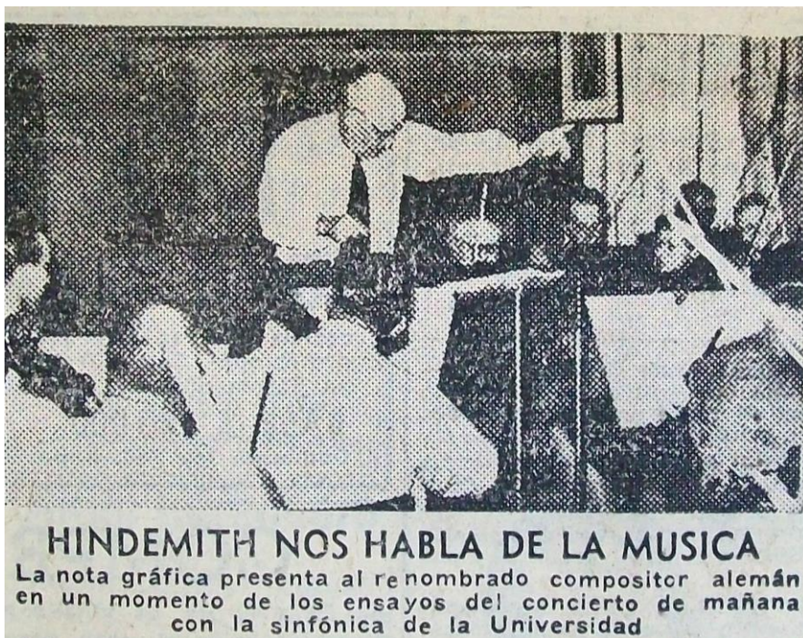
Imagen 5. Diario Los Andes , 6-X-1954. p. 5.

Antes del concierto, en un acto especial del que participaron autoridades provinciales y universitarias, le otorgaron el título de ‘Miembro Honorario’ del Instituto de Estudios Musicales de la Facultad de Filosofía y Letras de la Universidad Nacional de Cuyo. 31