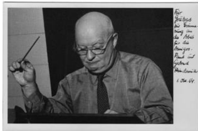
Imagen 1. Postal enviada por Hindemith a Graetzer, luego de la gira.

campo de la educación musical argentina. Para ello había convocado –entre otros- a Ernesto Epstein y a Erwin Leuchter. 10