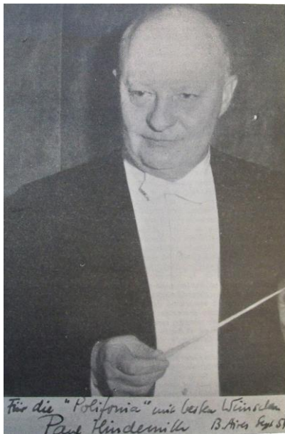
Imagen 9. Revista Polifonia , Año IX, N° 84-85, Ago-Sept, 1954. Dedicatoria: Für die "Polifonia", mit besten Wünschen [Para "Polifonia" con los mejores deseos]

Con su visita "Buenos Aires vuelve a una tradición añeja: ponerse personalmente en contacto con las figuras salientes de la creación musical." 41