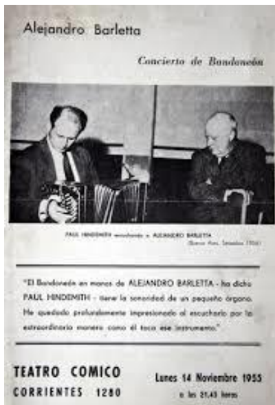
Imagen 8. Afiche de un concierto de Alejandro Barletta, en 1955. En la foto tomada en septiembre de 1954, Paul Hindemith lo escucha con atención.